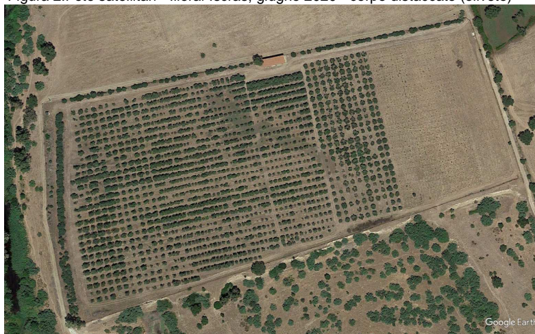
Figura 2. Foto satellitari - Illorai-Iscras, giugno 2020 - corpo distaccato (oliveto)

L'oliveto, oggetto della presente proposta di concessione, è quello relativo al campo n. 8, coltivato a olivo nella porzione in verde della fig.1 e ben visibile nella foto satellitare di destra.