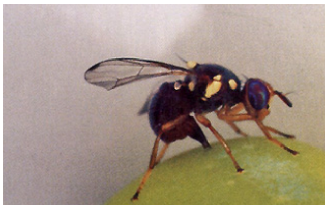
Femmina di Bactrocera oleae (Mosca dell'olivo)