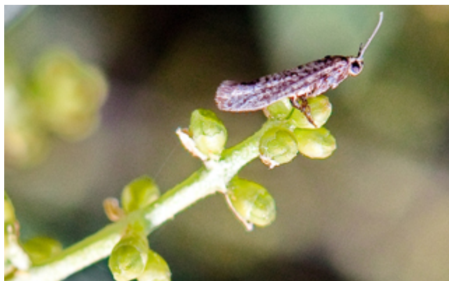
Tignola dell'olivo - Prays oleae